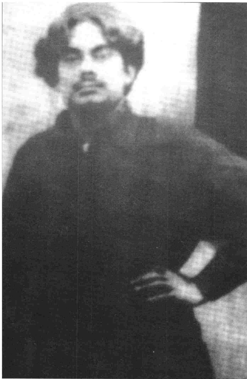
যুবক কাজী নজরুল ইসলাম